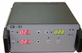
Boîtier de contrôle