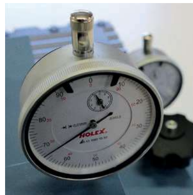
Ajuste por comparador al 1/100mm