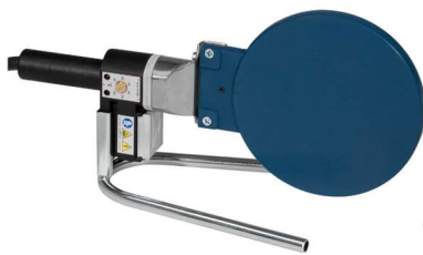
Chapa de soldadura SW-WELDING TOOL