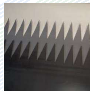
Corte simple Z