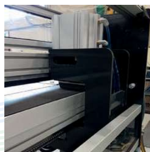
Cambio del cabezal